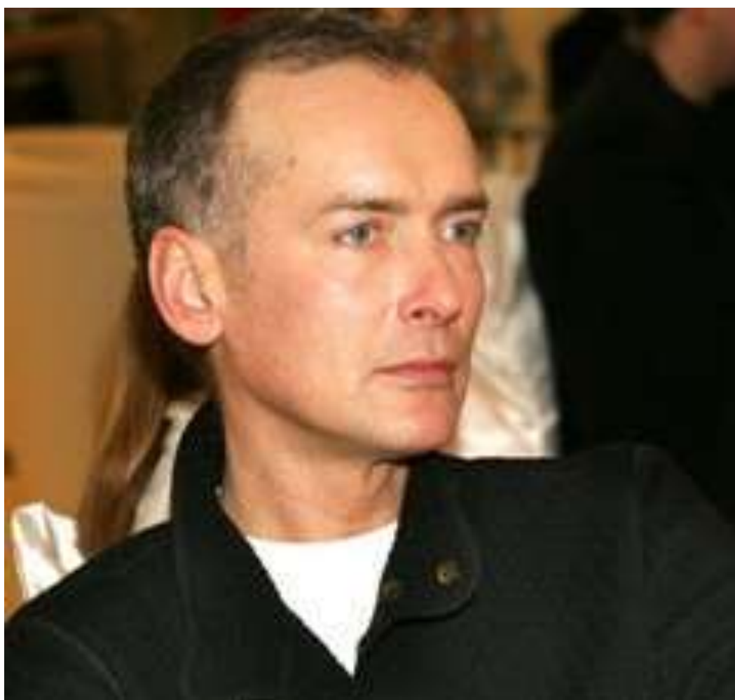
1960 — Леонид Геннадьевич Парфёнов , известный российский журналист, телеведущий.